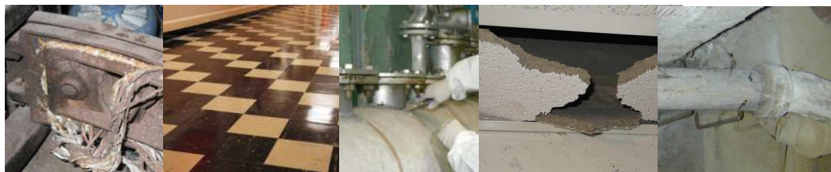
On trouve principalement des traces d'amiante dans ces matériaux